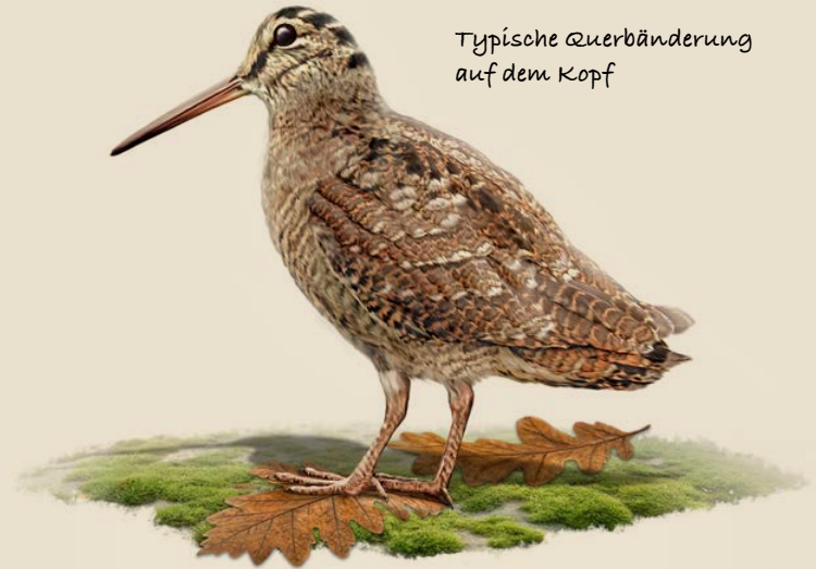
Typische Querbänderung auf dem Kopf